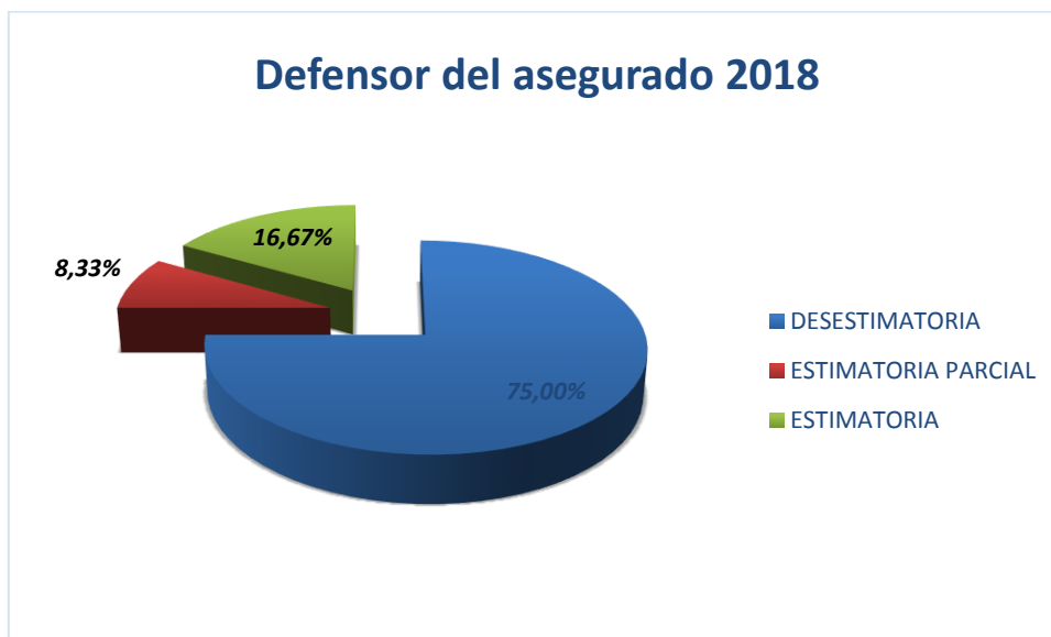
Gráfico 3 Promede Resolución DA 2018

Por último, en relación a las resoluciones de dichas reclamaciones, los datos son los siguientes: