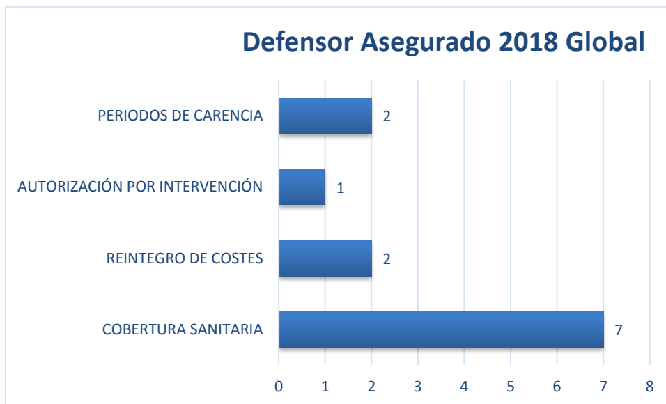
Gráfico 1 Promede Global 2018

A continuación se traslada gráficamente dicho resultado: